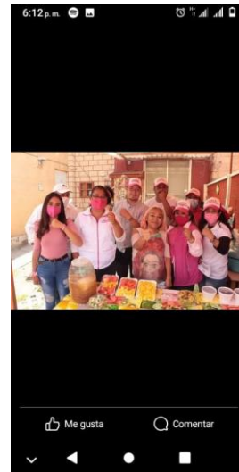
IMAGEN E HIPERVÍNCULO