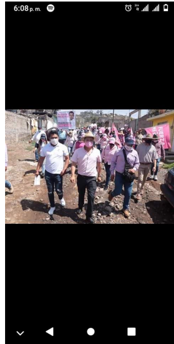
IMAGEN E HIPERVÍNCULO