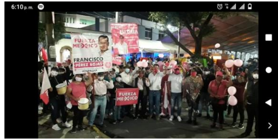
IMAGEN E HIPERVÍNCULO