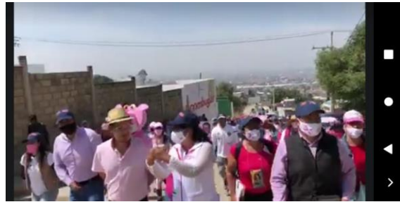
IMAGEN E HIPERVÍNCULO