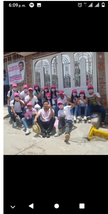
IMAGEN E HIPERVÍNCULO