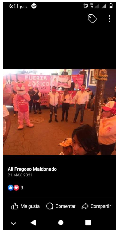
IMAGEN E HIPERVÍNCULO