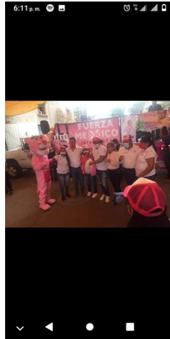
IMAGEN E HIPERVÍNCULO

candidatos, salen dañados, con respecto a su imagen, aceptando candidaturas, y apoyando a otro partido político.