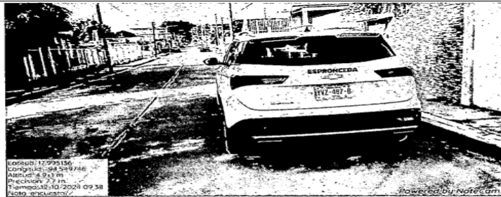
Antes del 12 de octubre/24

Fotografía tomada a una camioneta de marca Chevrolet donde se puede visualizar el apellido "ESPROCEDA"