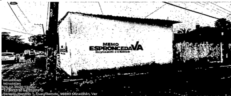
Antes del 9 de diciembre/24

Fotografía tomada a una barda de una casa, donde se puede visualizar la presunta propaganda donde dice: