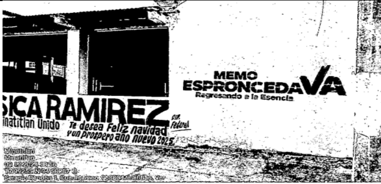
Antes del 9 de diciembre/24

Fotografía tomada a una barda de una casa, donde se puede visualizar la presunta propaganda donde dice: