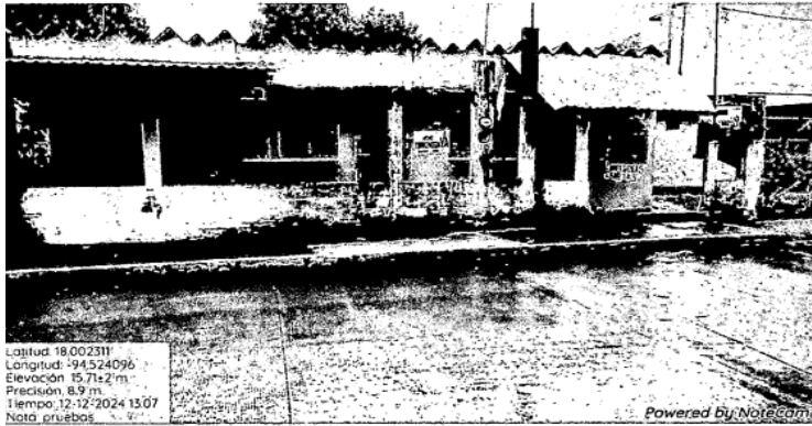
Antes del 12 de diciembre

Fotografía tomada a una barda de una casa, donde se puede visualizar la presunta propaganda donde dice: