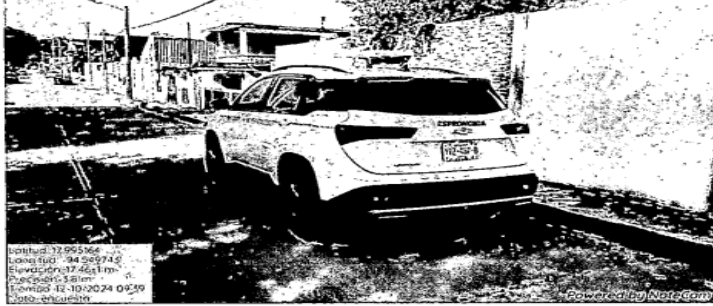
Antes del 12 de octubre/24

Fotografía tomada a una camioneta de marca Chevrolet donde se puede visualizar el apellido "ESPROCEDA"