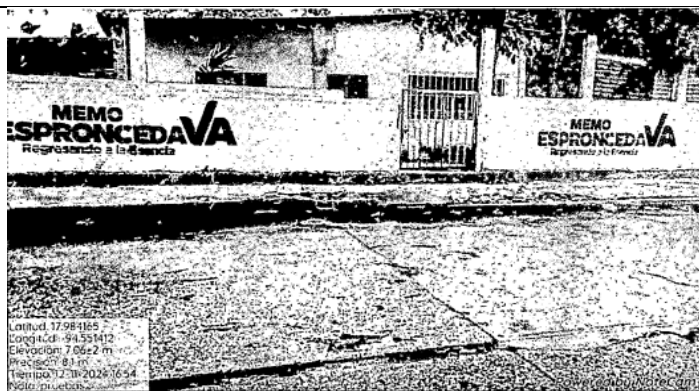
Antes del 12 de noviembre/24

Fotografía tomada a una barda de una casa, donde se puede visualizar la presunta propaganda donde dice: