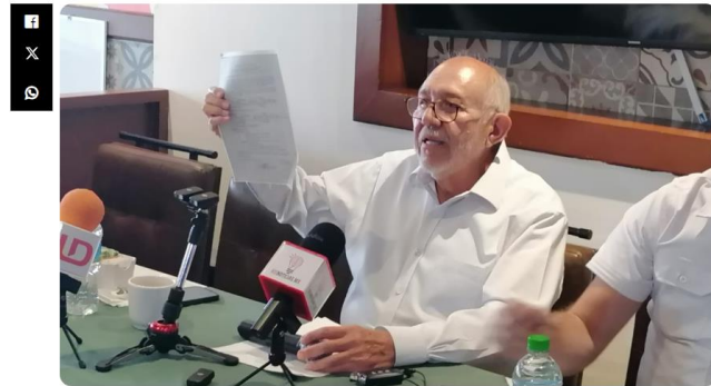
Mazatlán, Sin.- El exalcalde Luis Guillermo ‘Químico’ Benítez Torres en una conferencia de prensa anunció su candidatura a la diputación local por el distrito 22.

Por Luis Zatarain — 2024/04/06 5:00 PM. En Elecciones 2024. Política Tiempo de lectura: 3 minutos de lectura